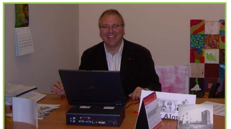
Una imatge que no es tornarà a repetir fins el maig

Havia organitzat l'horari de la meua feina al diari per poder estar tres matins a l'ajuntament. Això no podrà ser. Des de que vam guanyar les eleccions al 2007 vaig comprendre que, desgraciadament, a Altafulla no hi ha 8 grups municipals sinó dues formes d'entendre la població: aquells que la volem oberta i els que la volen tancada (com una mena de "cortijo"). I tenim una sèrie de gent que utilitzen unes sigles, per mi molt respectades, amb l'únic interès que res es mogui. Com a persona d'esquerres, la posició del PSC d'Altafulla (no confondre amb el PSC) és especialment dolorosa. Tinc molts amics i amigues en aquesta formació als quals respecte i, en alguns casos, admiro. Però el PSC d'Altafulla, des de fa temps, és un vaixell a la deriva que